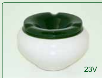
POSACENERE kg 0,4 Ø 11 H 7