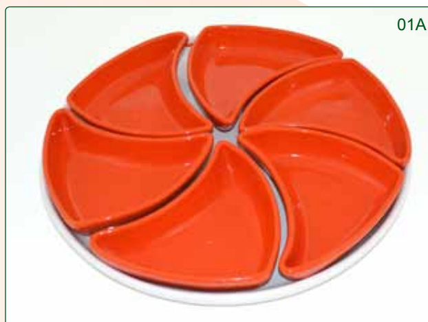
ANTIPASTIERA GIRELLA kg 3,5 cm 37