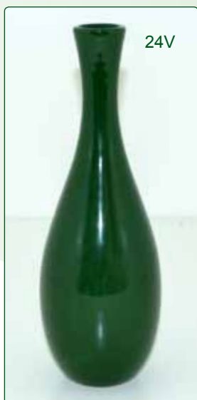
VASO CENTROTAVOLA kg 0,4 H 25