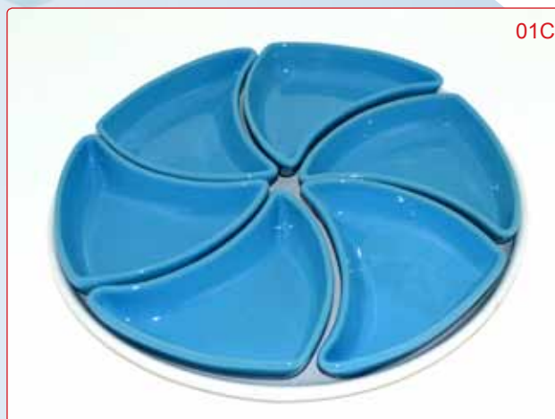
ANTIPASTIERA GIRELLA kg 3.5 cm 37