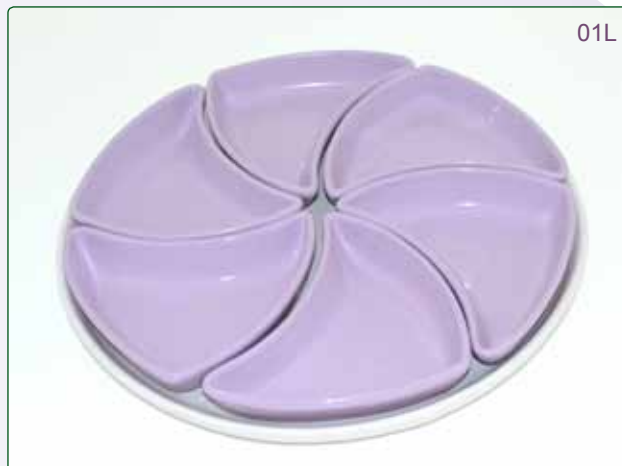
ANTIPASTIERA GIRELLA kg 3.5 cm 37