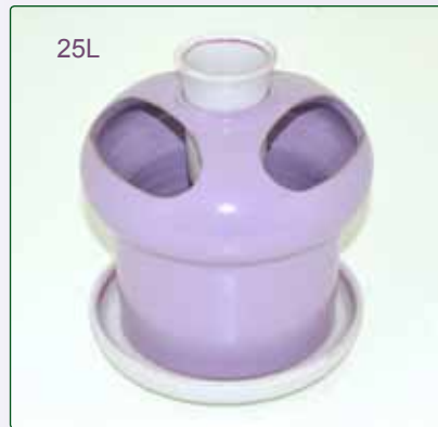
SCOLAPOSATE kg 0,9 Ø 15 H 18