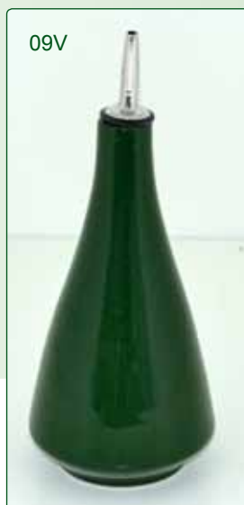
OLIERA kg 0,5 H 20