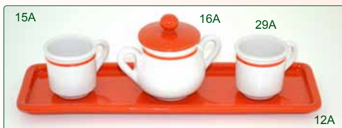
VASSOIO PORTATORRONE kg 0,5 L 35X11 TAZZINA DA CAFFÈ kg 0,1 Ø 5 H 6 ZUCCHERIERA kg 0,25 Ø 8 H 10