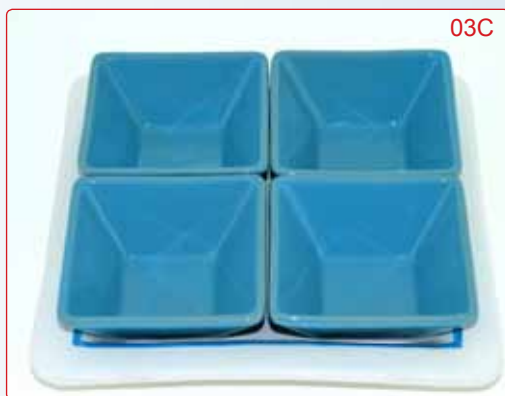
PORTASTUZZICHINI kg 1.9 26X26 11X11