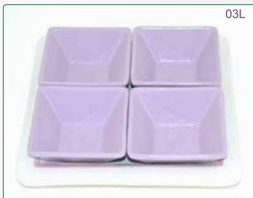
PORTASTUZZICHINI kg 1.9 26X26 11X11