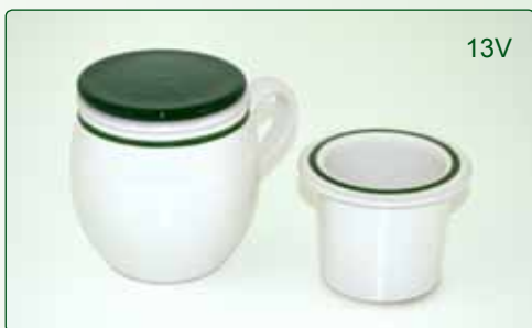
TISANIERA kg 0,6 Ø 10 H 11