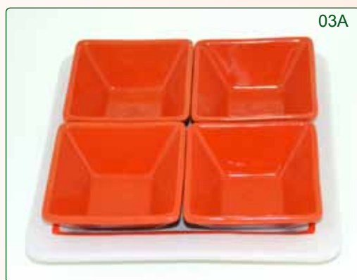
PORTASTUZZICHINI kg 1,9 26X26 11X11