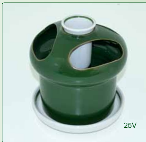
SCOLAPOSATE kg 0,9 Ø 15 H 18