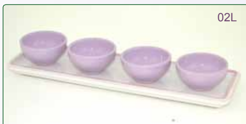
PORTASTUZZICHINI kg 0.8 35X11X7