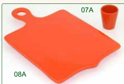
PORTASTECCHINI kg 0,07 Ø 5 H 6 TAGLIERE kg 1,0 22X34