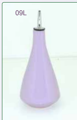
OLIERA kg 0.5 H 20