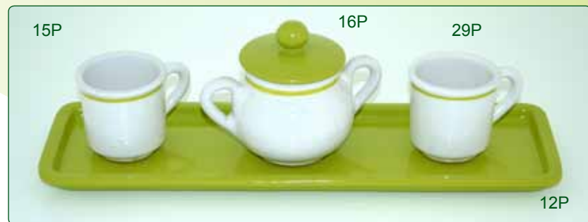
VASSOIO PORTATORRONE kg 0,5 L 35X11 TAZZINA DA CAFFE' kg 0,1 Ø 5 H 6 ZUCCHERIERA kg 0,25 Ø 8 H 10