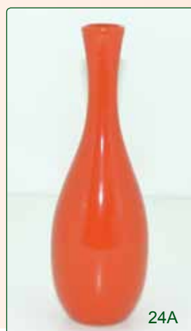
VASO CENTROTAVOLA kg 0,4 H 25