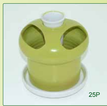
SCOLAPOSATE kg 0,9 Ø 15 H 18