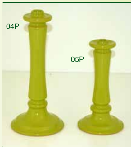
CANDELIERE kg 0,6 H 26 kg 0,5 H 20