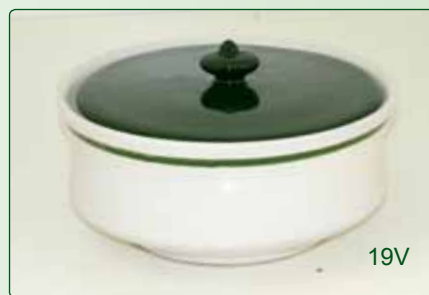
BISCOTTIERA kg 1.7 Ø 21 H. 10