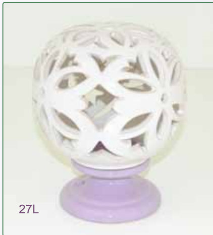
LAMPADA PALLA kg 1,7 Ø 15 H 20