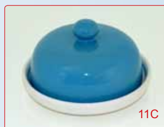
PORTABURRO kg 0.7 Ø 14 H 9