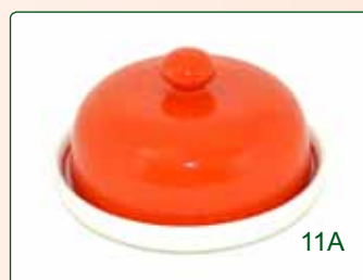
PORTABURRO kg 0,7 Ø 14 H 9