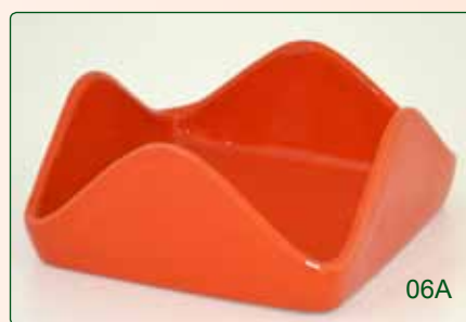
PORTATOVAGLIOLI kg 0,7 L 17X17