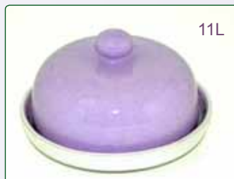
PORTABURRO kg 0.7 Ø 14 H 9