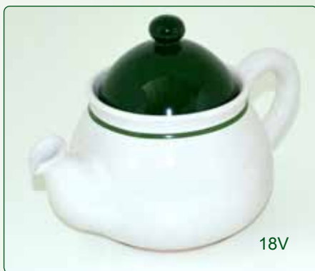
TEIERA X 4 kg 0,9 Ø 13 H 14