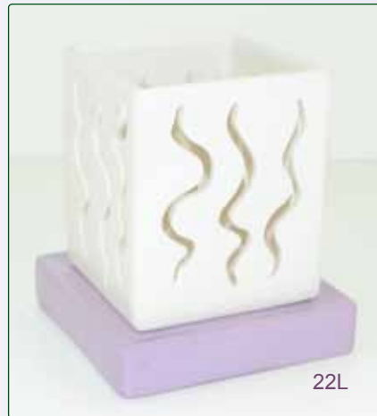
LAMPADA QUADRATA kg 1,7 14X14X20