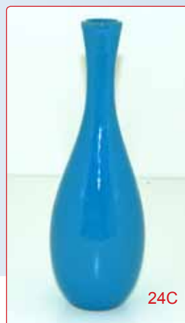
VASO CENTROTAVOLA kg 0,4 H 25