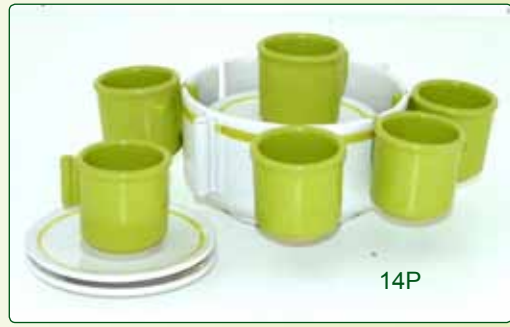
SET CAFFE' X 6 kg 2 Ø 16