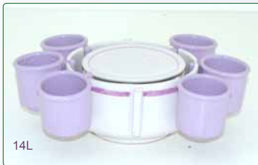
SET CAFFE' X 6 kg 2 Ø 16