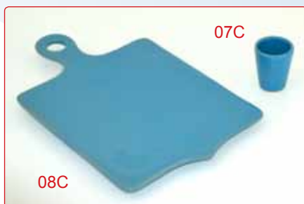
PORTASTECCHINI kg 0,07 Ø 5 H 6 TAGLIERE kg 1,0 22X34