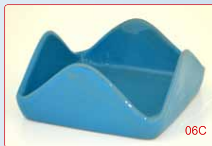
PORTATOVAGLIOLI kg 0.7 L 17X17