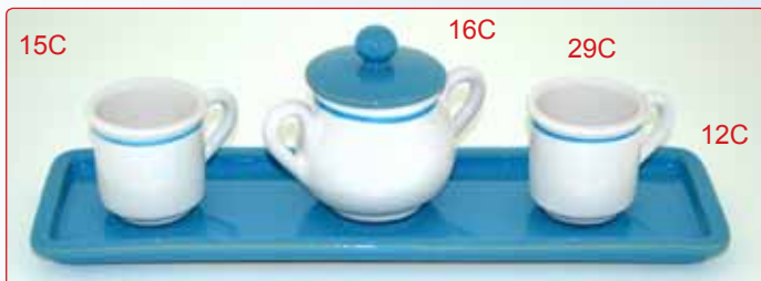
VASSOIO PORTATORRONE kg 0,5 L 35X11 TAZZINA DA CAFFÈ' kg 0.1 Ø 5 H 6 ZUCCHERIERA kg 0,25 Ø 8 H 10