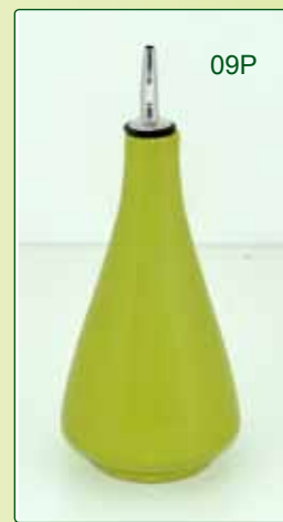
OLIERA kg 0,5 H 20