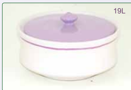
BISCOTTIERA kg 1.7 Ø 21 H. 10